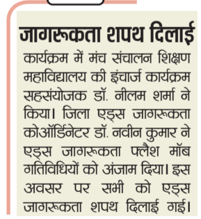
नारनौल। जागरूकता शपथ दिलाई गई।