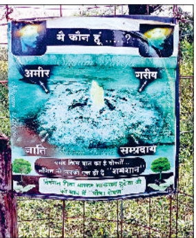
नारनौल। स्वर्ग आश्रम में पेड़-पौधों की सुरक्षा में लगाए गए बांस तथा पशुओं के बचाव में तैयार किए गए जागरूकता संदेश।

जब व्यक्ति के मरने पर शमशान में उनका अंतिम संस्कार किया जाता है, तब शव की अंतिम क्रिया करने के लिए बांस का उपयोग किया जाता है। उपयोग करने के बाद इस बांस को किसी काम में नहीं लिया जाता तथा इसे वहीं शमशान में ही डाल दिया जाता है और कुछ समय बाद यह बांस बेकार होकर खत्म हो जाता है, लेकिन शमशान के बिना उपयोगी माने जाने वाले इसी बांस को मोहल्ला खड़खड़ी निवासी तथा