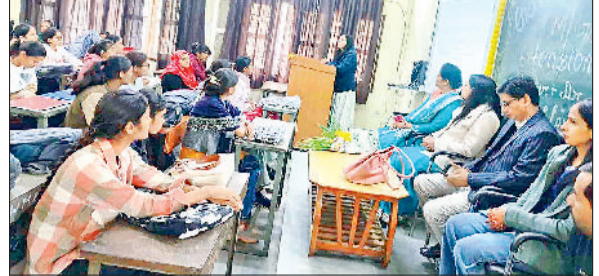
महेंद्रगढ़। कार्यक्रम में छात्राओं को संबोधित करते हुए।