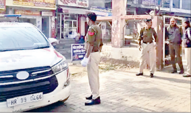
नारनौल। सूचना पाकर मौके पर पहुंची पुलिस।