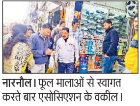
नारनौल। फूल मालाओं से स्वागत करते बार एसोसिएशन के वकील।