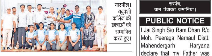
नारनौल। युद्वंशी कॉलेज की छात्राओं को सम्मानित करते हुए।

समाजसेवी सुभाष चंद्र बोस का जन्मदिन 20 नवंबर 2025 को जिला स्तरीय जागरूकता गतिविधियों को अंजाम दिया। इस अवसर पर सभी को एड्स जागरूकता शपथ दिलाई गई।