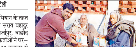
मंडी अटेली। सराय में पत्रक वितरित करते हुए।