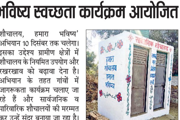
मंडी अटेली। खोड़ में बनाया गया सार्वजनिक शौचालय।

शौचालय, हमारा भविष्य' अभियान 10 दिसंबर तक चलेगा। इसका उद्देश्य ग्रामीण क्षेत्रों में शौचालय के नियमित उपयोग और रखरखाव को बढ़ावा देना है। अभियान के तहत गांवों में जागरूकता कार्यक्रम चलाए जा रहे हैं और सार्वजनिक व पारिवारिक शौचालयों की मरम्मत कर उन्हें सुंदर बनाया जा रहा है। सरकार ग्रामीण क्षेत्रों में स्वच्छता को बढ़ावा देना और खुले में शौच को समाप्त करना चाहती है। सरकार द्वारा शौचालय निर्माण हेतु 12,000 तक की आर्थिक सहायता भी प्रदान की जा रही है।