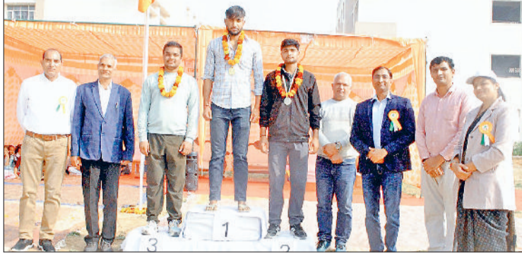
नारनौल। विजेताओं को सम्मानित करते हुए।