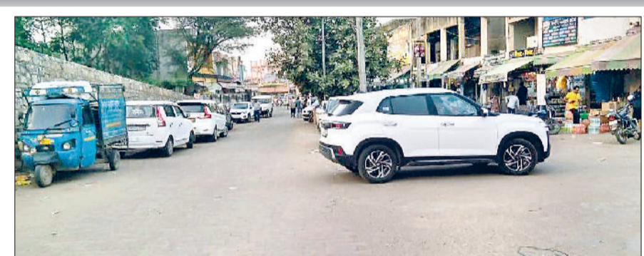
हरिभूमि न्यूज़ महेंद्रगढ़ नगर पालिका के गठन के बाद 30 वर्षों के बावजूद भी शहर में एक भी स्थान पर पार्किंग का निर्माण नहीं करवा पाई है। आए दिन बाजार में चार हजार से अधिक वाहन सड़कों पर खड़े रहते हैं, जिस कारण लोगों को परेशानी का सामना करना पड़ रहा है। शहर में स्थाई पार्किंग के अभाव में लोग भी मनमाने स्थानों पर वाहन पार्किंग करने को मजबूर है, जिससे शहर की सड़कें सिमटकर रह जाती हैं। नपा के गठन के बाद अभी तक के कार्यालय में अनेक बार पार्किंग की योजनाएं बनी, लेकिन एकबार भी धरातल नहीं उतरी।

नपा के गठन के बाद अभी तक के कार्यालय में अनेक बार पार्किंग की योजनाएं बनी