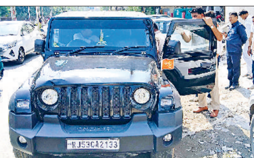
नारनौल। गाड़ी से ब्लैक फिल्म हटाती ट्रैफिक पुलिस।